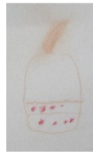
竹の子の下にある赤いフツツまでよく見て書いてくれました