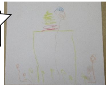
竹の子をみんなで見てるところを描いてくれました☆青いキャップをかぶった給食先生まで描いてくれました。ありがとうー！！