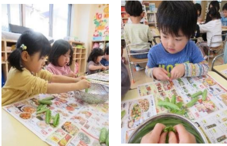
☆上手にとれましたよ☆