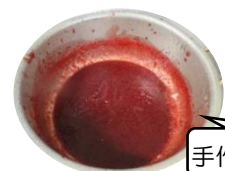
手作りイチゴジャム