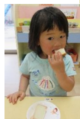
昨日、葉っぱ取ったの!