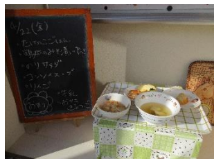
全体の食事の展示

帰る際は、子どもと一緒に見ていただき、その日の食事の様子などの話をいただければ嬉しく思います。